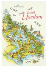
Karte [37] Hier eine Karte aus dem DDR-Kinderbuch O so dumm – Usedom:

Sie trug einen mit violetten Blumen übersäten Kittel, der von den Schultern herabhing, als ob er den hageren Körper darunter nicht mehr berührte. Am Himmel kreischten ein paar Möwen, aber vom Wasser war nichts zu sehen, nichts zu hören. Der Spülsaum des Meeres war einen knappen Kilometer entfernt, genau so weit weg wie das Schilf des Achterwassers, eine Ausbuchtung des Peenestroms, der die Insel vom Festland trennte.