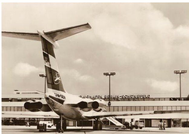
Flugzeug [6] ,eine Tupolew 134, Motiv. Vgl. S. 17 [48]

Postkarte [5] Die Postkarte sieht nicht ganz so aus wie beschrieben, aber es gibt sie: